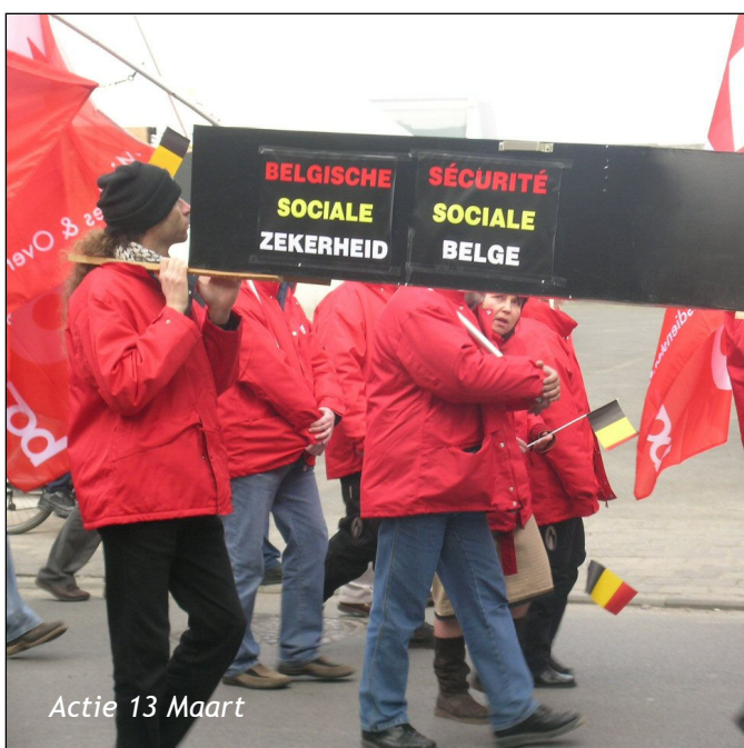
Actie 13 Maart