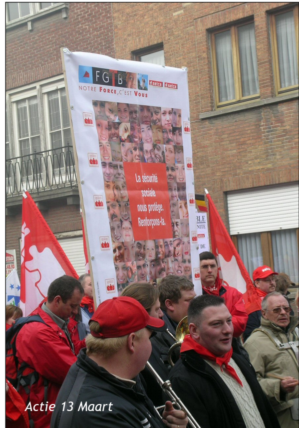
Actie 13 Maart

'Ik weiger een discussie over transfers op het vlak van de sociale zekerheid', aldus De Leeuw. 'De sociale zekerheid betekent solidariteit tussen mensen. Dat gebeurt volgens dezelfde regels in heel het land. De 3,6 miljard euro transfers waarover men in het Warandemanifest, een Vlaamse separatistische drukingsgroep vooral bevolkt met patroons, spreekt, zitten aan de inkomstzijde. Vlaanderen draagt meer bij omdat het economisch sterker staat. Maar aan de uitgavenkant zijn er geen verschillen per hoofd van de bevolking tussen het noorden en het zuiden van het land.